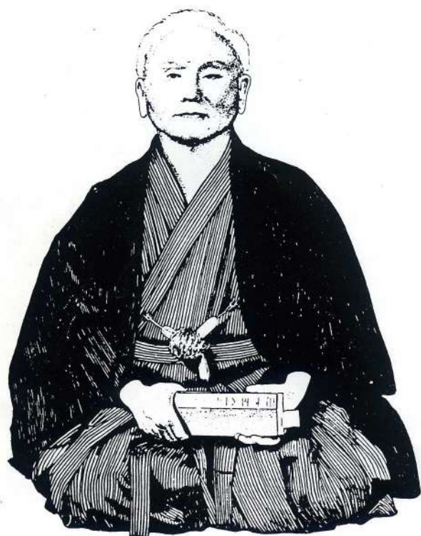
Me Funakoshi, fondateur du Karatédo Shotokai.

Par la suite, cette science descend en Chine, et s'adapte aux situations troublées de l'époque (guerres, famines, etc...). Au fil des siècles, l'aspect philosophique se réduit, même si les maîtres qui l'enseignent veulent préserver essentiellement l'aspect spirituel.